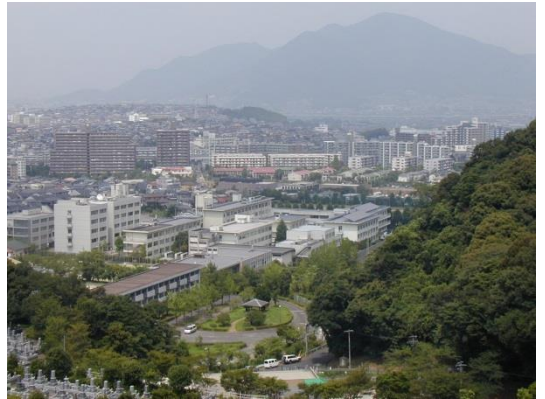
40周年を迎えた本校